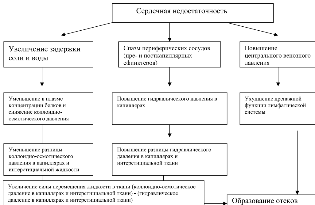
Рис. 1. Патогенетические факторы образования отеков при ХСН.