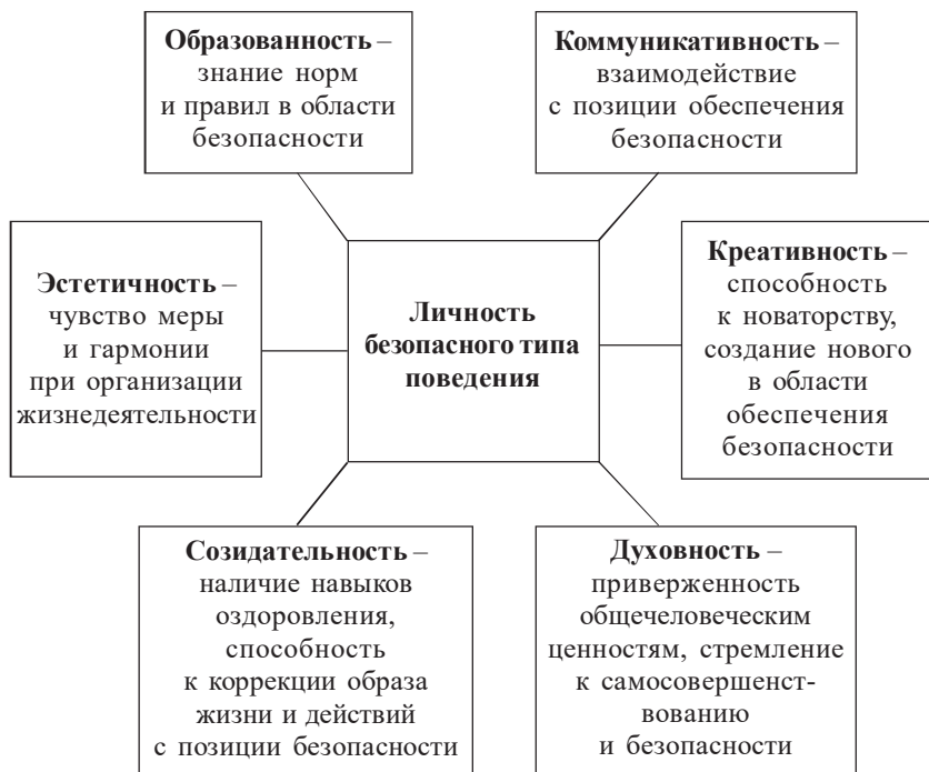
Рис. 1. Компоненты структуры личности безопасного типа поведения