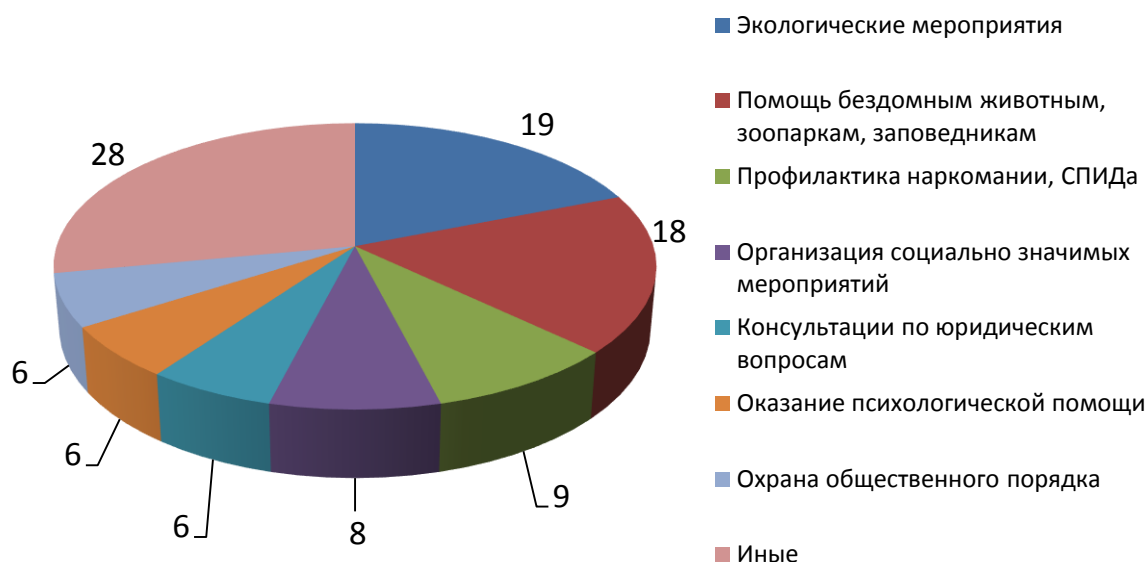
Рис. 1. Основные виды волонтерской деятельности, %

К числу наиболее востребованных видов добровольческой деятельности относятся также экологические мероприятия (19 %) и помощь бездомным животным, зоопаркам, заповедникам (18 %). Значительно меньше тех, кто готов принимать участие в просветительских беседах, направленных на профилактику наркомании, СПИДа и т. д. (9 %), организации социально значимых мероприятий (8 %), в консультациях по юридическим вопросам и оказании психологической помощи, охране общественного порядка (по 6 %) [18].