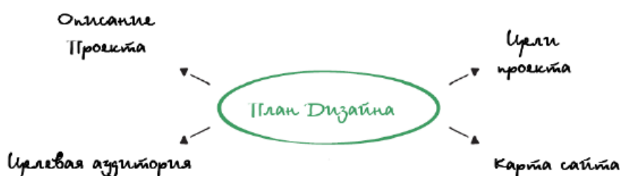
Рисунок 1. План дизайна