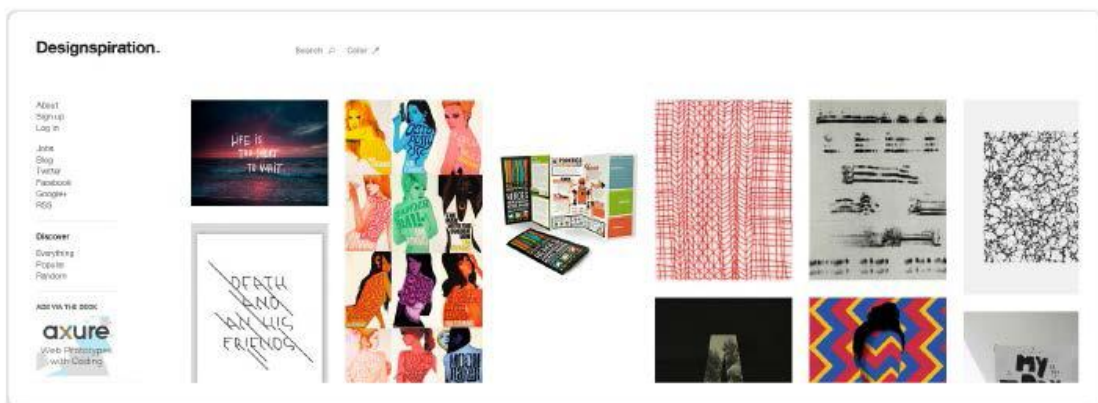
Рисунок 1.3. Главная страница сайта Designspiration