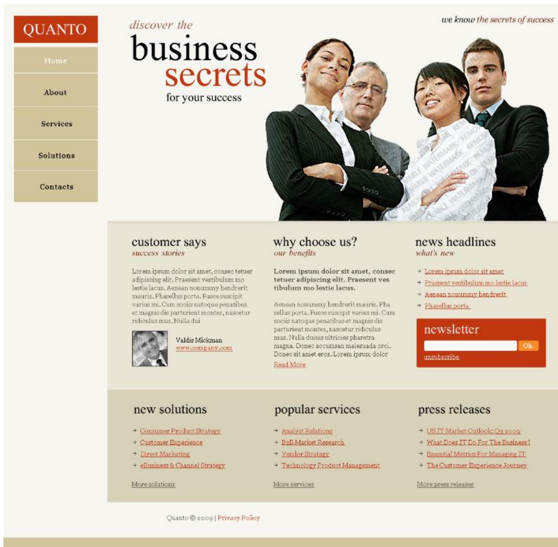
(рис 2. Макет сайта QUANTO с навигацией в левом столбце)